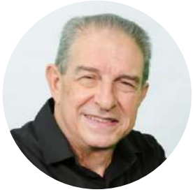
Por Sidney Fernandes

Os propósitos da vida dependem do seu significado em sua amplitude maior. Os sofrimentos por que passamos, com os quais precisamos lidar com resiliência, são justificados pela sobrevivência à morte, pois a vida física é um estágio de aprendizado no nosso mundo de relações.