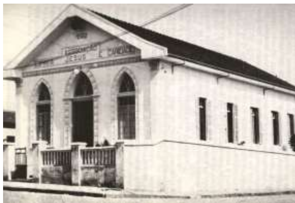
Associação Espírita Jesus e caridade, de Mogi Mirim, fundada em 1933.

Devotados Benfeitores Espirituais estão cooperando em nosso favor, e devemos confiar na proteção de Jesus, hoje e sempre.”“.